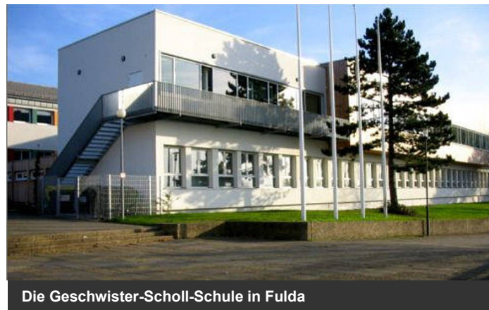
Die Geschwister-Scholl-Schule in Fulda

Da Praxis ein wichtiger Bestandteil dieses Angebots ist, setzen wir voraus, dass Interessenten aktiv die gebotene Chance nutzen wollen, die sie durch das Angebot von PuSch erhalten!